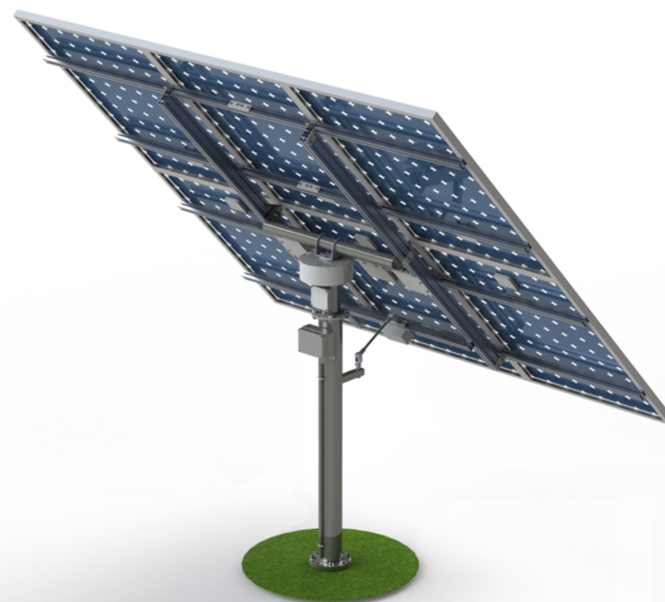
Heliomotion PV-6M Märkeffekt: 1890 watt Daglig produktion: 14-20 kWh Årlig produktion: 2100-4000 kWh Storlek: 3.3x3.0 m

* Heliomotion M modeller använder Maysun 315W paneler