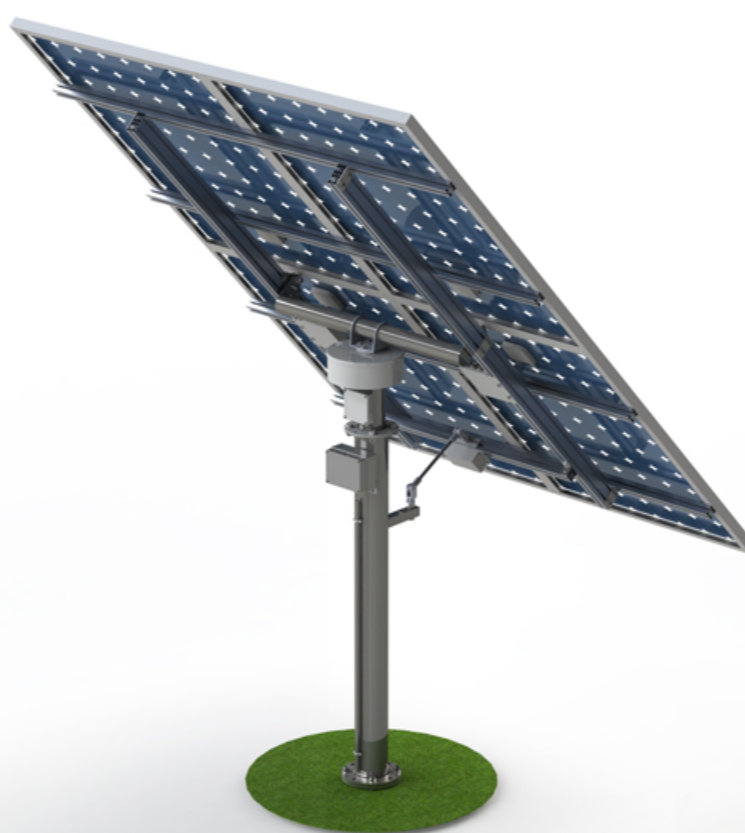
Heliomotion PV-4M Märkeffekt: 1260 watt Daglig produktion: 9-14 kWh Årlig produktion: 1400-2700 kWh Storlek: 3.3x2.0 m