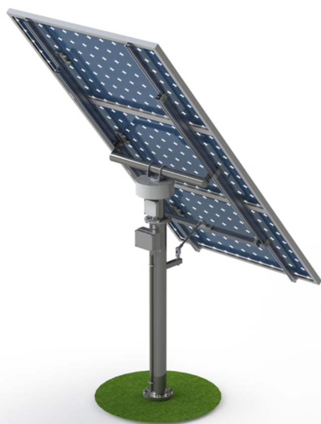
Heliomotion PV-3M Märkeffekt: 945 watt Daglig produktion: 7-11 kWh Årlig produktion: 1050-2000 kWh Storlek: 3.0x1.6 m

Heliomotion solkraftverk tillverkas i Finland i flera olika storlekar för både nätbundet och batteribundet bruk. Vanligen används PV-3 till sommarstugor, PV-4 till små villor (1-2 personer) och PV-6 till större villor (3-4 personer). Besök oss gärna på heliomotion.com eller kontakta oss på heliomotionplant@gmail.com för mer information.