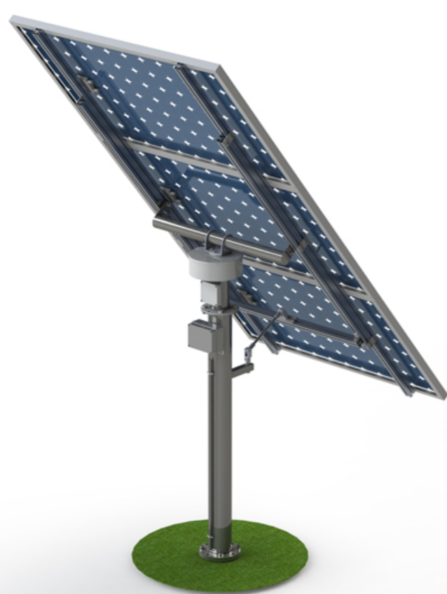
Heliomotion PV-3S Vermogen: 1200 watt Dagelijkse productie: 9-15 kWh Jaarlijkse productie: 1400-2700 kWh Afmetingen: 2.0x3.0 m

De Heliomotion zonnevolgers zijn ontworpen en gefabriceerd in Finland. Ze zijn verkrijgbaar in verschillende maten voor zowel netgebonden als off-grid, als er extra vermogen nodig is, kunnen er meerdere zonnevolgers worden geplaatst in de buurt van elkaar. Om meer te weten komen over onze oplossingen, bezoek heliomotion.com of neem contact met ons op heliomotion@e-technics.be