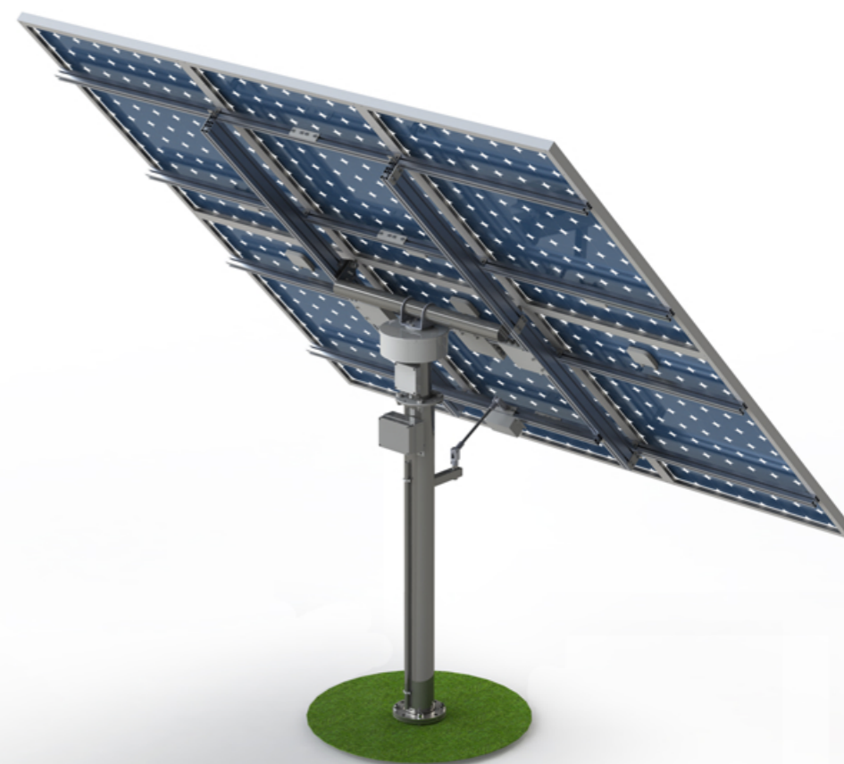
Heliomotion PV-6S Vermogen: 2400 watt Dagelijkse productie: 18-27 kWh Jaarlijkse productie: 2800-5300 kWh Afmetingen: 3.0x4.0 m

* Heliomotion S-modellen gebruiken SunPower 400 watt-panels