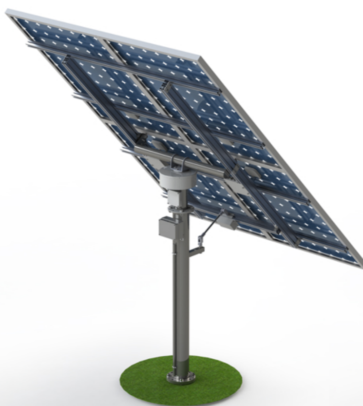
Heliomotion PV-4S Vermogen: 1600 watt Dagelijkse productie: 12-19 kWh Jaarlijkse productie: 1800-3600 kWh Afmetingen: 2.0x4.0 m